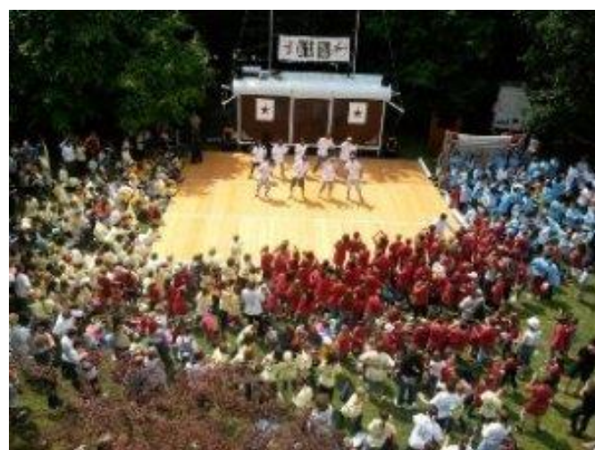
Il n'y a pas de limite à la créativité.

Plurielles ! Nos activités provoquent les rencontres , bousculent les usages, mélangent les histoires de vies, construisent une réelle mixité . Le « vivre ensemble », la tolérance, l'ouverture y deviennent réalité.