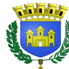
Mairie LE CATEAU-CAMBRESIS