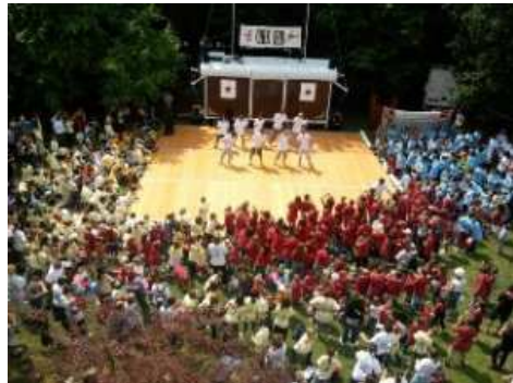
Il n'y a pas de limite à la créativité.